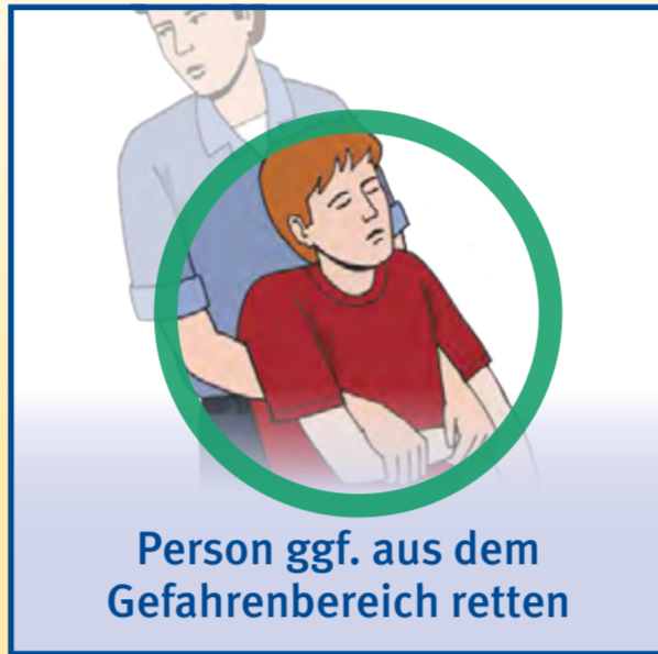
Person ggf. aus dem Gefahrenbereich retten