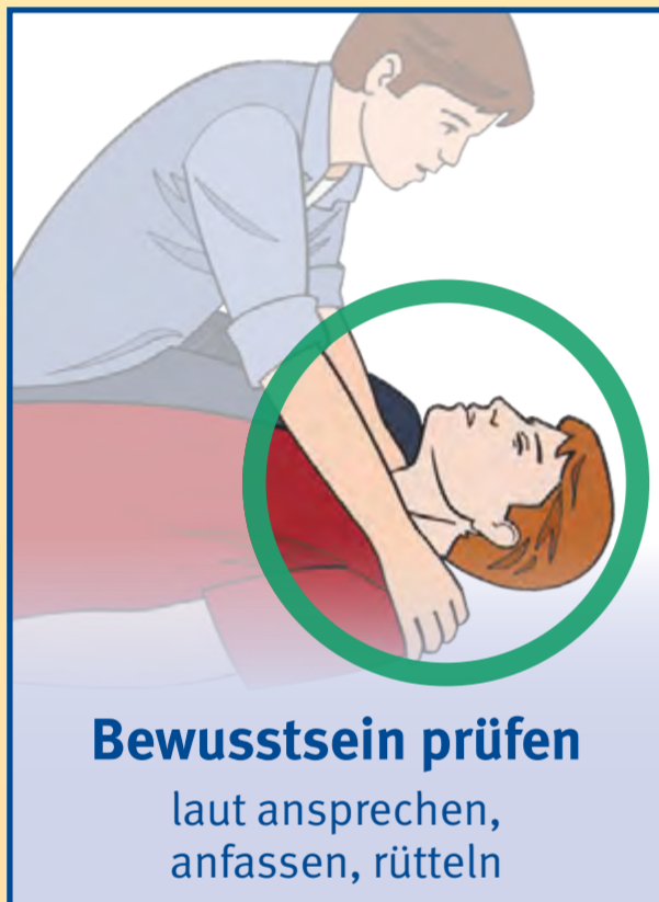
Bewusstsein prüfen laut ansprechen, anfassen, rütteln