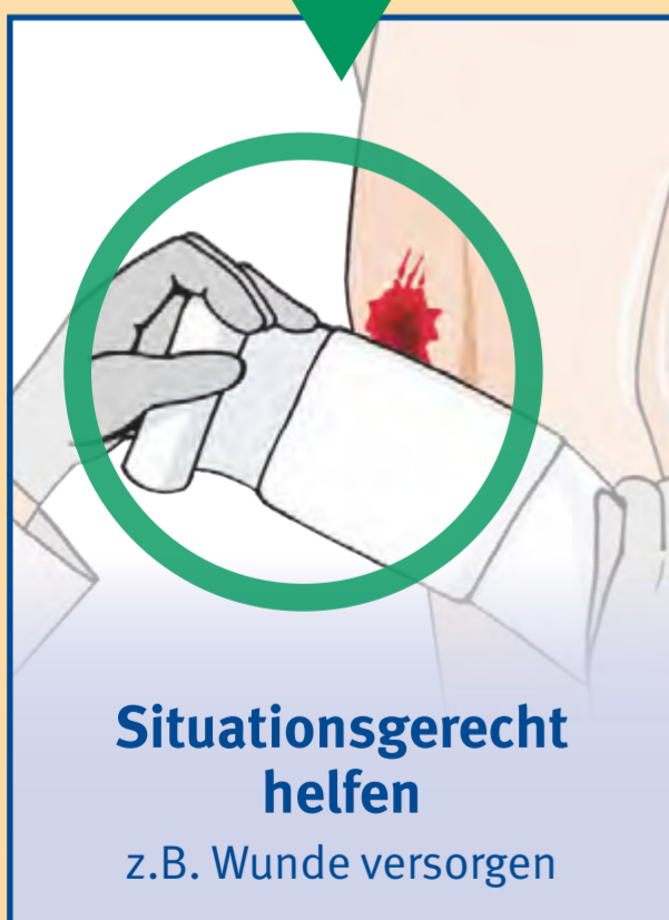
Situationsgerecht helfen z.B. Wunde versorgen