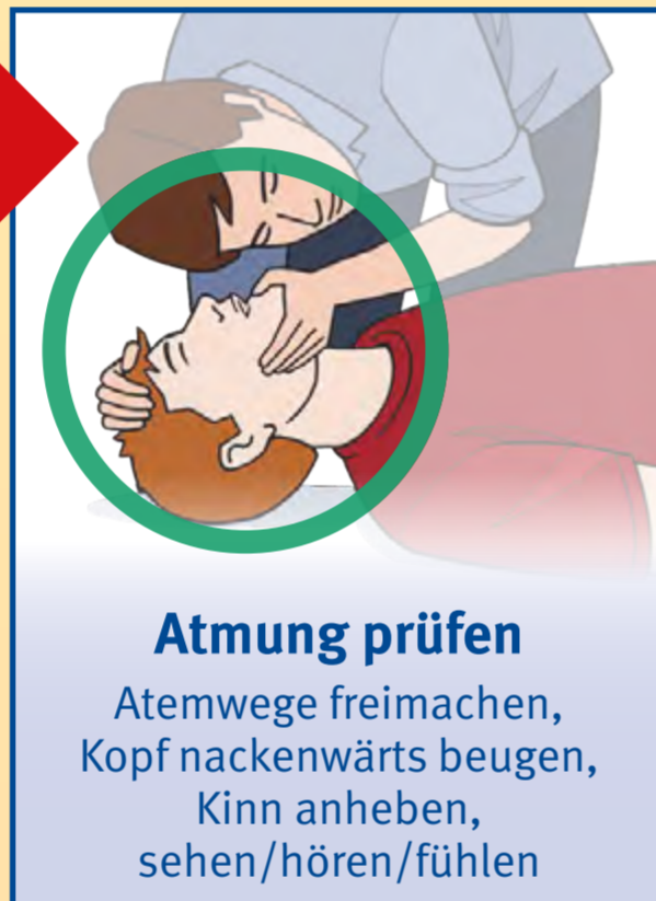
Atemung prüfen Atemwege freimachen, Kopf nackenwärts beugen, Kinn anheben, sehen/hören/fühlen